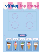
놀이 상자 (아이스크림 가게)