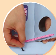
놀이 상자의 가판대를 내리고, 끈을 끼워서 가게를 만들어요.