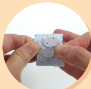
위쪽을 끼워서 아이스크림을 만들어요.