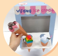
아이스크림을 꽂아서 가게놀이를 해요.